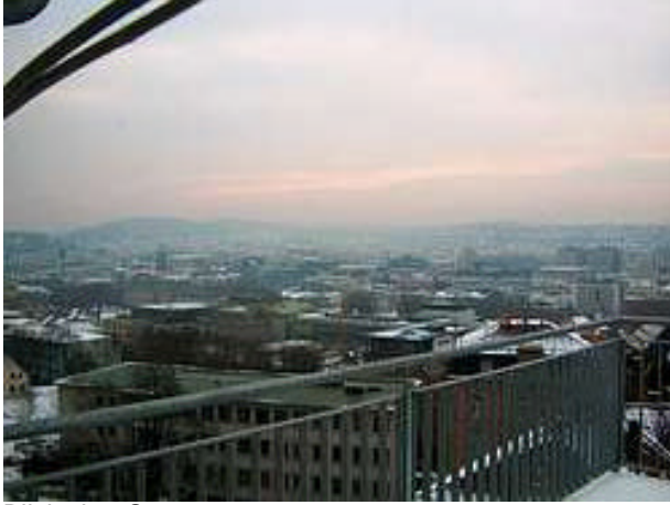
Blick über Stuttgart

Unsere Studenten beteiligten sich im Rahmen dieser Messe am Wettbewerb Golden Shirt Award mit einem Projekt. T-Shirts wurden bedruckt, bestickt und beflockt. So kombinierten sie verschiedene Veredlungstechniken miteinander. Die Studenten bekamen auf dieser Messe viele neue Eindrücke und Einblicke in die verschiedensten Techniken sowie deren Umsetzung.