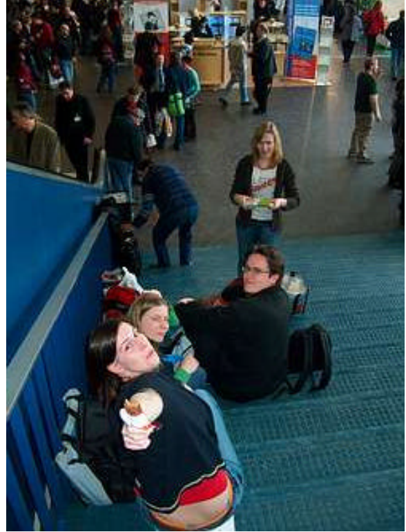
...nach vielen Kilometern Fußweg durch die Messehallen ist eine kleine Pause nötig!