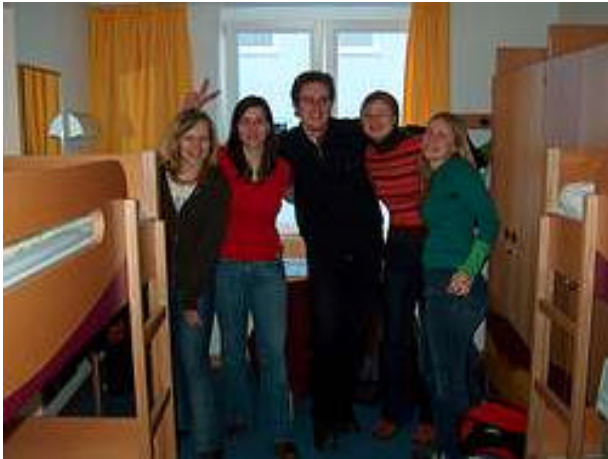
In der Jugendherberge