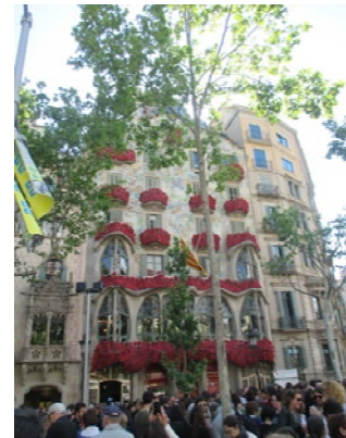
Casa Batlló zum Feiertag am 23. April Sant Jordi dekoriert mit Papierrosen

Resümierend kann ich nur jeden bestärken, nach Möglichkeit eine solche Erfahrung, egal ob in Form eines Auslandspraktikums oder Auslandssemesters zu machen. Nur so kann man die Sprache und das Land, für das man sich interessiert, wahrnehmen und ganz bewusst erleben. Auch die Entscheidung ein Semester in Portugal und das folgende in Spanien zu verbringen, empfand ich für mich persönlich als die richtige Wahl. Meiner Meinung nach ist es wichtig, sich auf die Länder und die Kulturen mit welchem man vor Ort konfrontiert wird einzulassen. Man sollte sich nicht auf seine deutsche Erwartungshaltung versteifen, sondern vielmehr offen sein, für die andere Kultur, die Eigenheiten und den Alltag der Menschen. In einigen Bereichen kann man sich schnell an die im Land vorherrschende Art und Weise im Umgang anpassen. In anderen wiederum merkt man, dass man aus einer anderen Nation stammt und sich trotz Weltoffenheit, Anpassungsfähigkeit und interkulturellem Einfühlungsvermögen vielleicht gar nicht anpassen kann oder auch möchte.