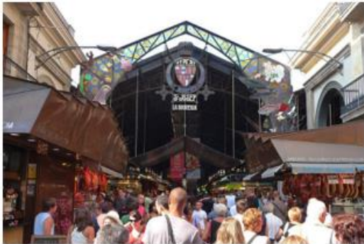
Mercado La Rambla

alles gefallen, aber wirklich mal diese Vielfalt zu sehen und zu beobachten, wie ein Tintenfisch auseinandergenommen wird, ist definitiv interessant.