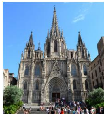
Catedral de Barcelona

Besonders interessant finde ich persönlich die großen Markthallen, wie es sie z.B. auf La Rambla gibt. Einerseits massenhaft farb- und geruchsintensive Früchte, Kräuter und Nüsse, andererseits aber auch die Fleisch- und Meeresabteilung. Mir hat besonders in letztere nicht