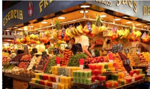
Mercado La Rambla

Wem das nicht reicht, der kann sich auch mit den zahlreichen Ausflugsmöglichkeiten befassen. So kann man sich z.B. in Girona auf die Spuren von „Game of Thrones“ begeben oder das Bergkloster Montserrat besuchen. Mit Bus oder Zug sind diese Ziele zeitnah zu erreichen und bieten sich somit optimal für einen Tagesausflug an.